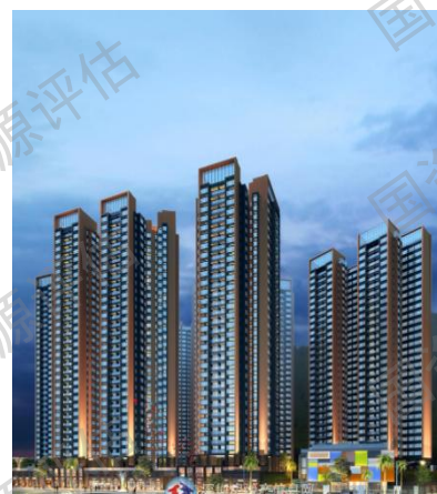
京基智农山海御园