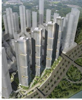
华润城润玺二期花园