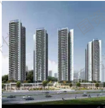
电建洺悦鹏著花园