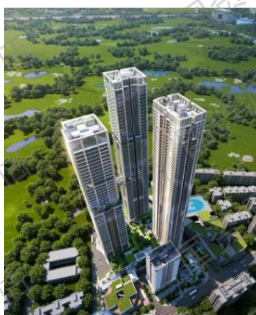
富通九曜公馆、富通上舍