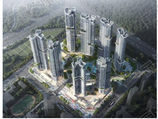
海德园 A、B 区