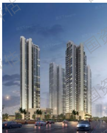
中海万锦熙岸华庭